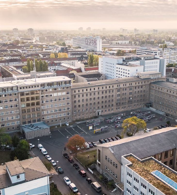
Das einst abgeriegelte Gelände bietet heute zahlreiche Besuchsangebote.