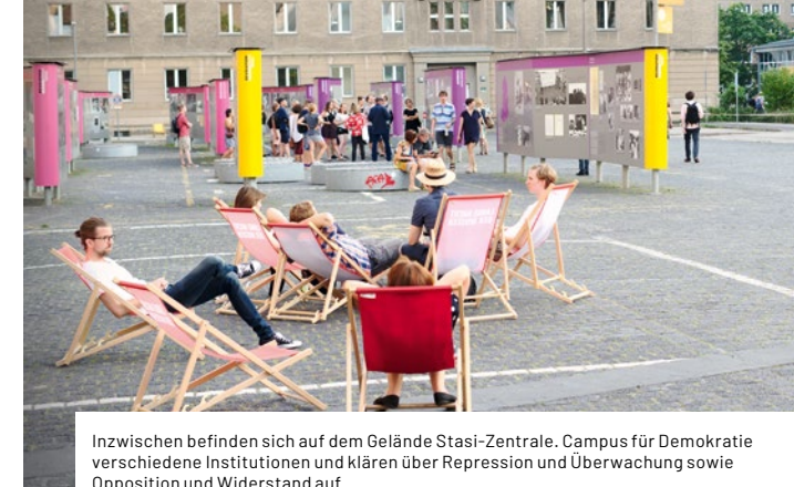
Inzwischen befinden sich auf dem Gelände Stasi-Zentrale. Campus für Demokratie verschiedene Institutionen und klären über Repression und Überwachung sowie Opposition und Widerstand auf.