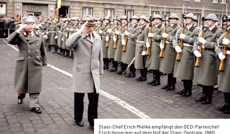
Stasi-Chef Erich Mielke empfängt den SED-Parteichef Erich Honecker auf dem Hof der Stasi-Zentrale, 1980.