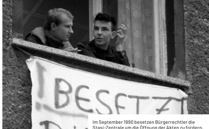
Im September 1990 besetzen Bürgerrechtler die Stasi-Zentrale um die Öffnung der Akten zu fordern.